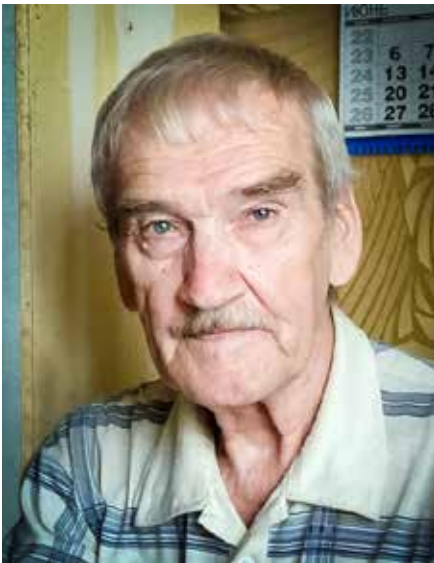
De Russische officier Stanislaw Petrow

Na de tweede wereldoorlog (1935-1945) ontwikkelde zich een over tientallen jaren heen een oost-west conflict, waarbij het om de machtspositie in de wereld ging. De westelijke machten werden door de USA aangevoerd, de oostelijke machten door de voormalige Sovjetunie. Omdat het nooit tot een directe militaire confrontatie kwam tussen de beide supermachten, spreekt men van een koude oorlog. Gedurende deze spannende decennia stond de wereld meerdere malen voor een derde wereldoorlog. Dat het in het jaar 1983 niet zover kwam, is – menselijk gezien – de verdienste van Stanislaw Jewgrafowitsch Petrow.