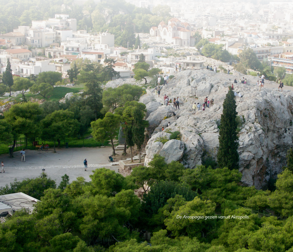
De Areopagus gezien vanuit Akropolis.

In 1 Korintiërs 9: 20-22 schrijft de apostel Paulus hoe hij zich altijd perfect aanpast aan zijn gesprekspartners: 'Ik ben voor de Joden geworden als een Jood ...'(vs. 20). En ook 'die zonder de wet zijn' wilde hij winnen (vs. 21). Daarmee bedoelde hij de niet-Joden, de 'Grieken' (de volken).