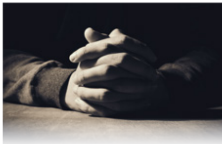
Het begrip 'aanbidding'

We willen dit belangrijke onderwerp aan de hand van vragen en antwoorden behandelen. Op deze manier zouden we moeten worden aangemoedigd om actieve aanbidders te worden. Aanbidding heeft een centrale plaats in het Christelijk leven. Als mensen die door het kostbare bloed van het Lam zijn verlost (1 Petr. 1:18-19), hebben we alle reden om ons voor God in aanbidding neer te buigen.