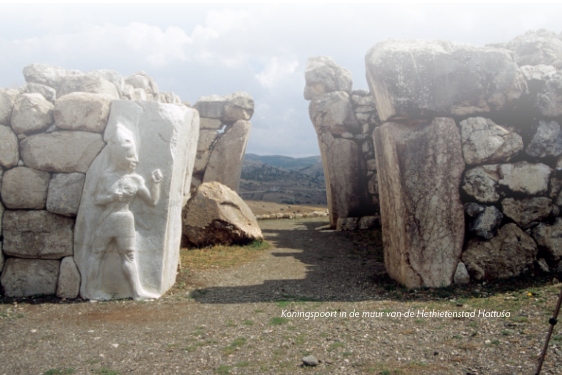
Koningspoort in de muur van de Hethietenstad Hattuša

Het verhaal van David en Bathseba verbinden wij met een dieptepunt in de geschiedenis van David, met echtbreuk en moord, maar ook met schuldbelijdenis en vergeving. Maar één persoon raakt daarbij misschien wat op de achtergrond: Uria, de Hethiet, de man van Bathseba. Ook al weten we niet veel over hem, toch is het weinige heel leerzaam.