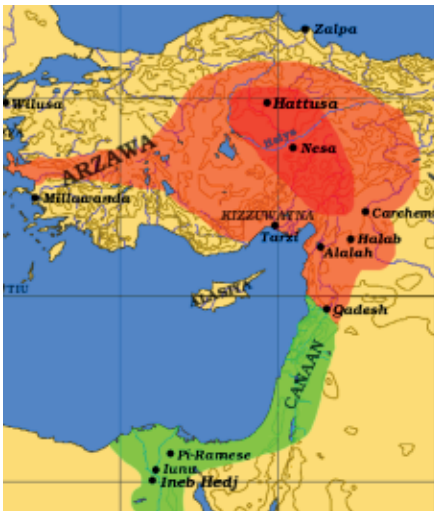
Het Hethietenrijk (donkerrood de uitbreiding omstreeks 1590 v. Chr., lichtrood die van 1300 v. Chr.)

De Hethieten waren een reusachtig volk, dat in Klein-Azië gevestigd was, dat voor een deel naar Kanaän ver-